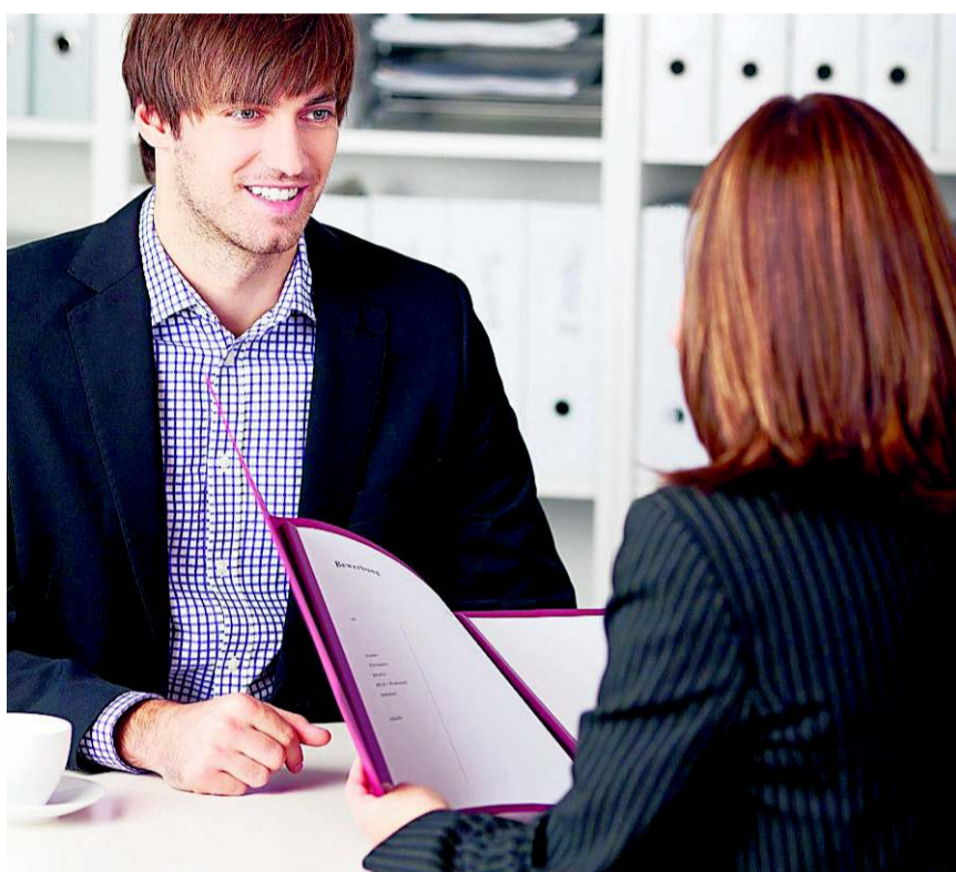
Gut vorbereitet ins Bewerbungsgespräch – die Jobchancen steigen.

INZWISCHEN KURSIEREN Hitlisten der peinlichsten Patzer: Da werden Fingernägel gefeilt, Personalchefs gefragt, ob man sich nach dem Gespräch zu einem Drink treffen kann. Da bedienen sich Kandidaten unerlaubterweise im Pausenraum der Angestellten mit Snacks. Und es wird offen gesagt: «Ich arbeite nicht gerne mit anderen.» – Schlechte Voraussetzungen, wenn man sich für ei-